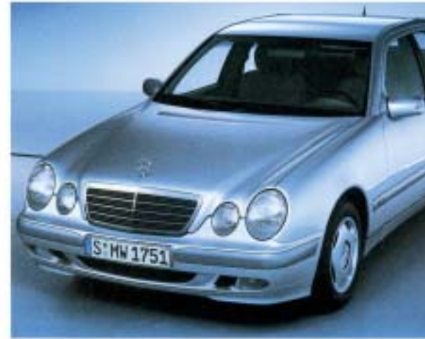
Die neue E-Klasse

Vereinbaren Sie mit uns 1 Probefahrt - Termin, Anruf genügt.